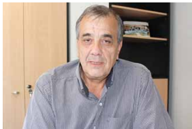
SERGIO DONELLI SECRETARIO DE ACCIÓN SOCIAL

Ante cualquier duda o necesidad de información podrán comunicarse con nuestra Sede Central, telefónicamente al 011 4126-0900 a la línea gratuita 0800 222 2727 o por vía mail a: prestacionesmedicas@ospapel.org.ar