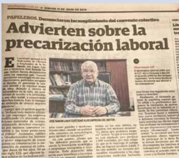
Nota publicada en diario Crónica el jueves 11 de julio

Nuestra Federación reconoce la invitación en la posibilidad de participar en estas discusiones empresariales en la comprensión que la parte trabajadora debe estar presente en toda instancia en la que se debata el futuro de nuestro sector.